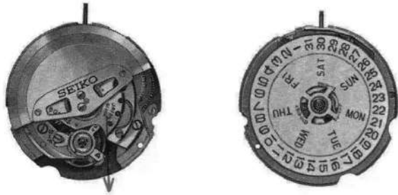
キャリバーNo. 6146 A