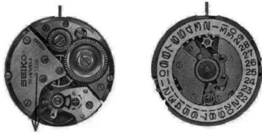
キャリバー No. 5722B