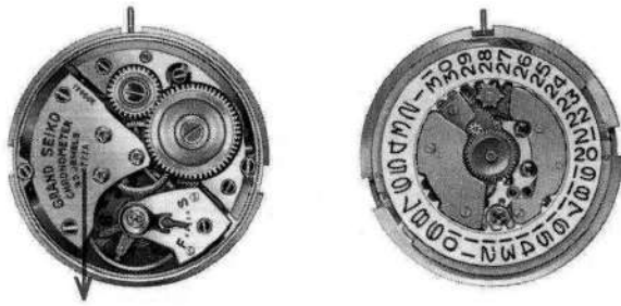
キャリバー No. 5722A (又は430)