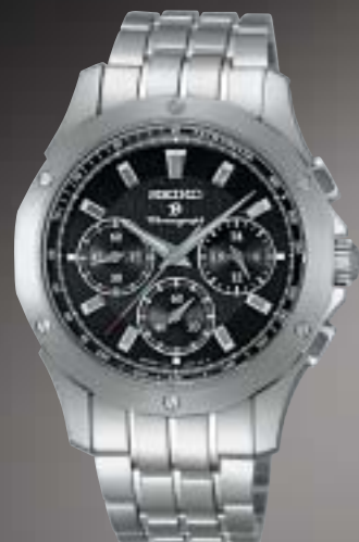
SAGJ011 105,000円 (税抜 100,000円)

ブライトチタンケース カーブサファイアガラス(無反射コーティング) ルミブライトつき 日常生活用強化防水(10気圧) 耐磁 電池寿命約5年 24時針つき ストップウォッチ機能(60分計、最大計測時間12時間) 精度:年差±20秒 SAGJ015・017:クロコダイルバンド(ミツ折中留)