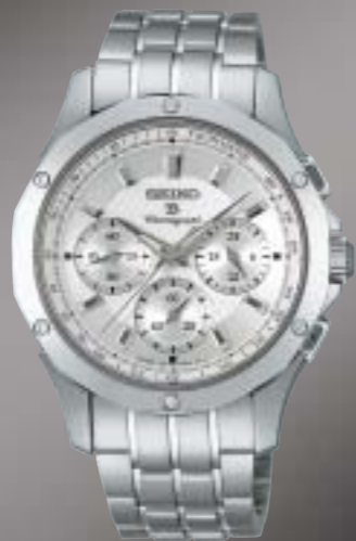
SAGJ013 105,000円 (税抜 100,000円)