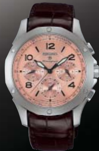
SAGJ017 99,750円 (税抜 95,000円)