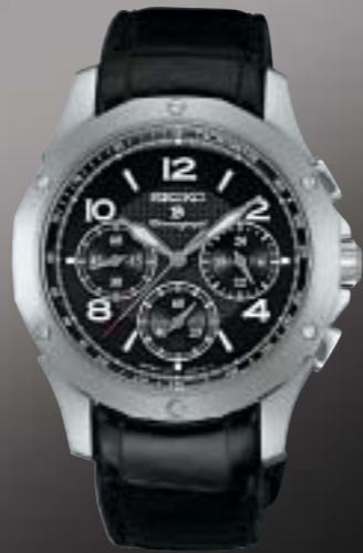
SAGJ015 99,750円 (税抜 95,000円)