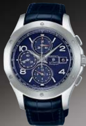
SAGP005 241,500円 (税抜 230,000円) [数量限定モデル 200個限定] メカニカルウォッチ 4月発売予定