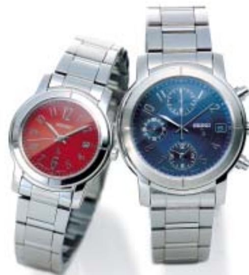
SSVK059 ¥36,750 (税抜¥35,000)