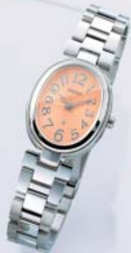
NEW SSVY043 ¥39,900 (税抜¥38,000)