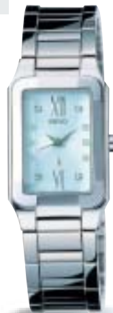
SSVY023 ¥49,350 (税抜 ¥47,000) ダイヤ入りダイヤル