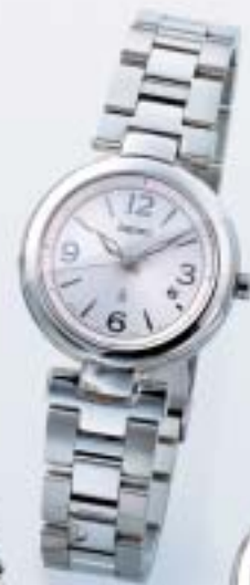
NEW SSVK063 ¥37,800 (税抜¥36,000)