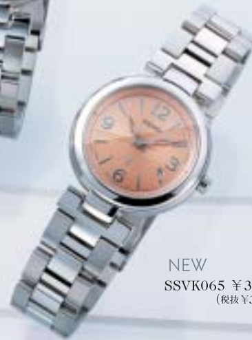
NEW SSVK065 ¥37,800 (税抜¥36,000)