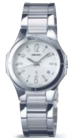
SSVK045 ¥36,750 (税抜 ¥35,000)