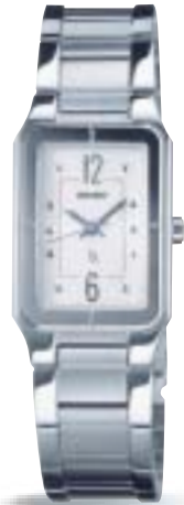
SSVY011 ¥38,850 (税抜 ¥37,000)