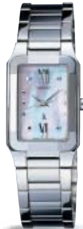
SSVY019 ¥39,900 (税抜 ¥38,000) 白蝶貝ダイヤル