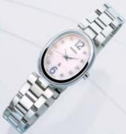
NEW SSVY045 ¥52,500 (税抜¥50,000) ダイヤ入り白蝶貝ダイヤル LIMITED EDITION for Summer 限定2,000個 6月上旬発売予定