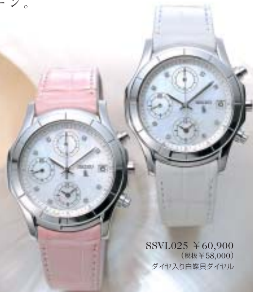
SSVL021 ¥60,900 (税抜¥58,000) ダイヤ入り白蝶貝ダイヤル