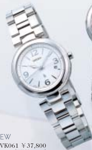
NEW SSVK061 ¥37,800 (税抜¥36,000)