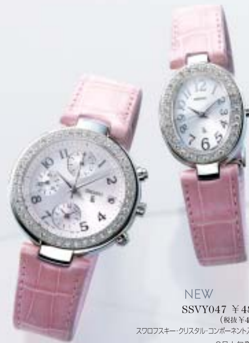
NEW SSVL041 ¥52,500 (税抜¥50,000) スワロフスキー・クリスタル・コンポーネント入りケース 6月上旬発売予定