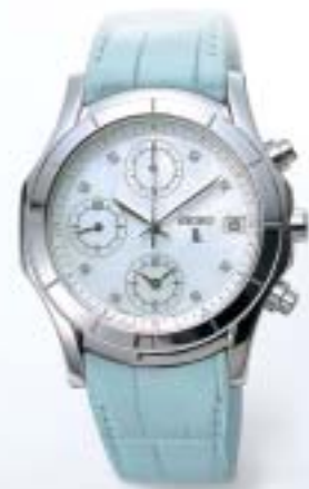
SSVL023 ¥60,900 (税抜¥58,000) ダイヤ入り白蝶貝ダイヤル