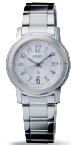
SSVK057 ¥36,750 (税抜¥35,000)