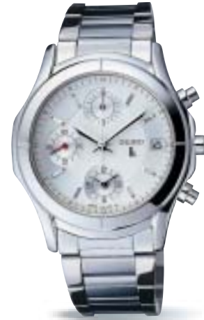
SSVL013 ¥42,000 (税抜 ¥40,000)