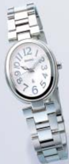
NEW SSVY041 ¥39,900 (税抜¥38,000)