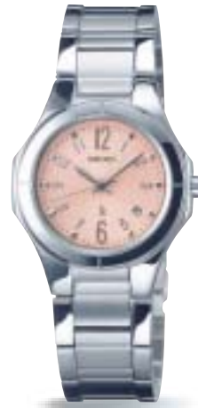
SSVK053 ¥36,750 (税抜 ¥35,000)