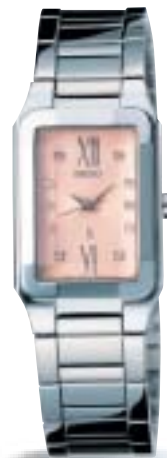
SSVY025 ¥49,350 (税抜 ¥47,000) ダイヤ入りダイヤル