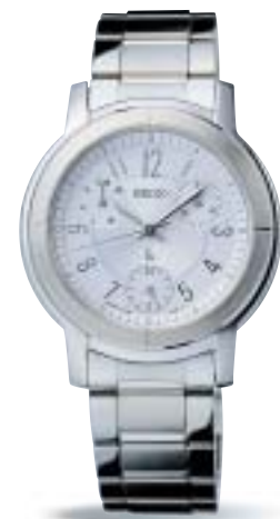
SSVC009 ¥39,900 (税抜¥38,000)