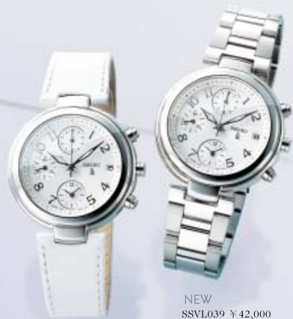
NEW SSVL037 ¥39,900 (税抜¥38,000)