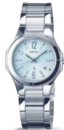
SSVK051 ¥36,750 (税抜 ¥35,000)