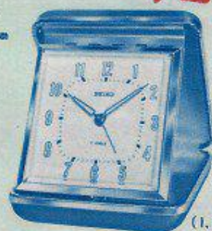
(1,500円) 85 mm × 72 mm 旅のお伴に トリップメイト 1,000円より