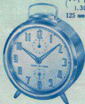
(バイトーン) 1,300円 125 mm × 110 mm 実用的な目ざまし時計 コロナ 1,100円より