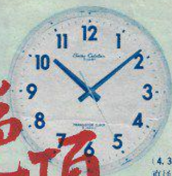
(4,300円) 直径270 mm 電池式掛時計の花形 トランジスタ掛時計 4,300円より