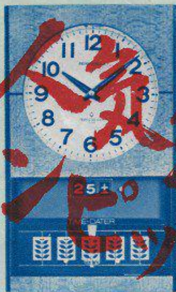
(ソノラタイムデーター 5,800円) 417 mm × 256 mm 時を打つトランジスタ掛時計 ソノラ 4,500円より