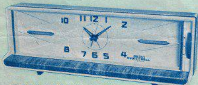
目ざましつきオルゴール時計 ミュージックベル 2,500円より (2,800円) 114 mm × 325 mm