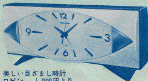
美しい目ざまし時計 ロビン 1,000円より (1,500円) 120 mm × 281 mm