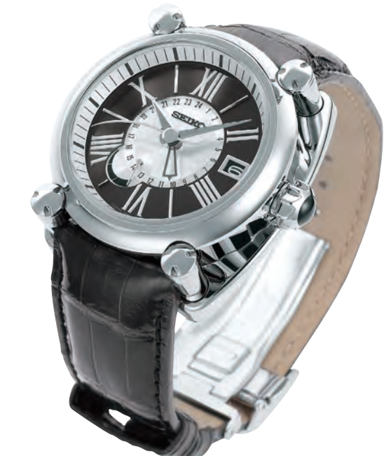
SBLA047 SR66<0AC-0AB> 540,000円 + 税