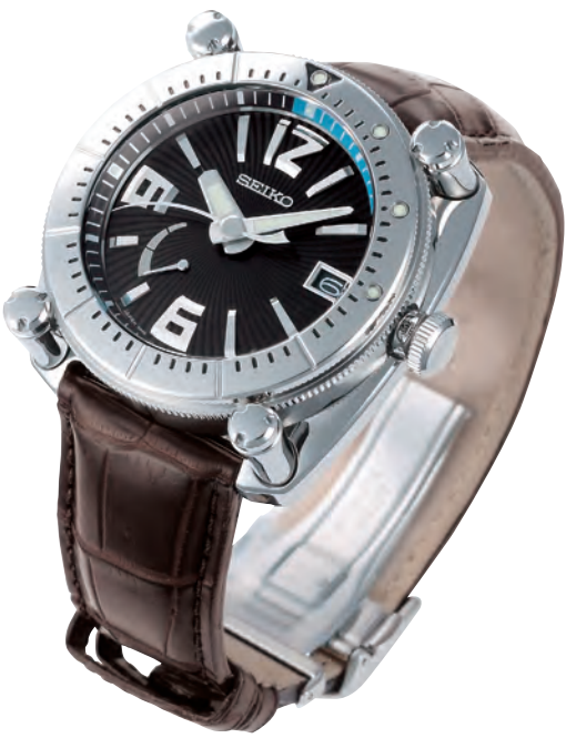
SBLA069 SR65<0AH-OAF> 600,000円＋税