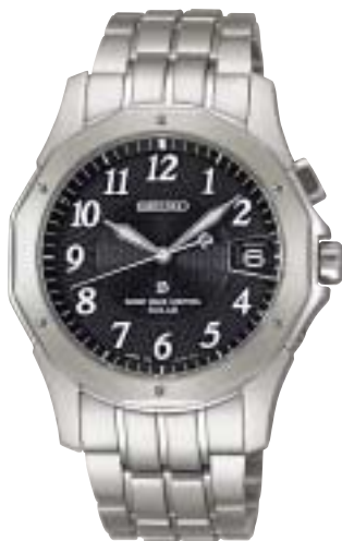
SAGZ003 94,500円 (税抜90,000円)