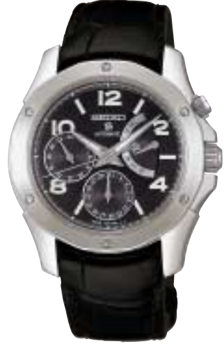
SAGN013 178,500円 (税抜170,000円)

ルミブライトつき 裏ぶた:純チタン カーブサファイアガラス(無反射コーティング)