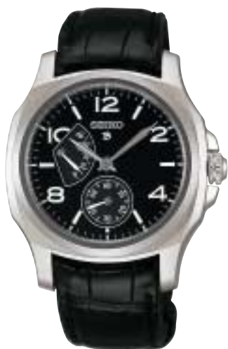
SAGN005 157,500円 (税抜150,000円)

メカニカルウォッチという以上に、手仕事の温もりを感じるのは、 熟練の職人技だけが成せる、ホーローダイヤルを採用しているからだろうか。