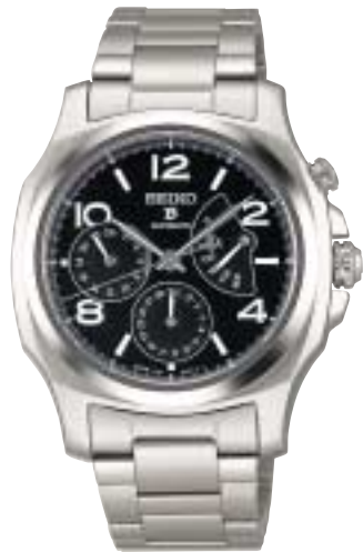
SAGN007 189,000円 (税抜180,000円)

裏ぶた:ブライトチタンとサファイアガラス(シースルー) デュアルカーブサファイアガラス(無反射コーティング) ホーローダイヤル