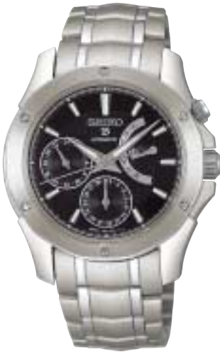
SAGN009 189,000円 (税抜180,000円)

日曜日から月曜日に日付が変わる時、瞬時に針が戻るレトログレード式曜日機構。 高性能メカニカルムーブメントでありながら、どこか懐かしさを感じさせてくれる。