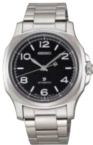
SAGL003 157,500円 (税抜150,000円)

自動巻き(手巻きつき) 最大巻上時約50時間持続 石数24石 クロコダイルバンド(ミツ折方式中留)