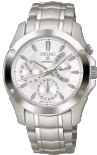
SAGN011 189,000円 (税抜180,000円)

ルミブライトつき 裏ぶた:純チタン カーブサファイアガラス(無反射コーティング)