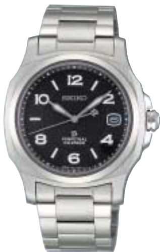
SAGM005 105,000円 (税抜100,000円)