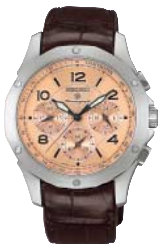
SAGJ017 99,750円 (税抜95,000円)