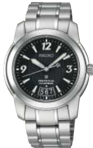
SAGM009 84,000円 (税抜80,000円)