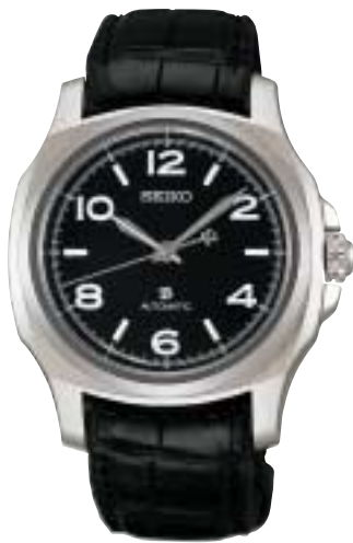
SAGL001 147,000円 (税抜140,000円)

手巻き 最大巻上時約40時間持続 石数29石 パワーリザーブ表示機能 クロコダイルバンド(ミツ折方式中留)