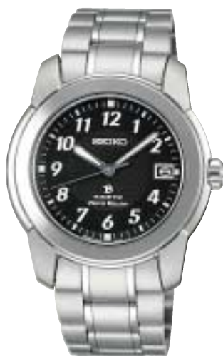
SAGC001 84,000円 (税抜80,000円)