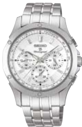
SAGJ013 105,000円 (税抜100,000円)