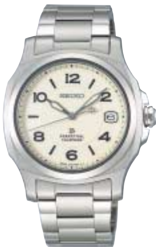
SAGM007 105,000円 (税抜100,000円)