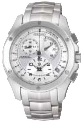
SAGE003 126,000円 (税抜120,000円)