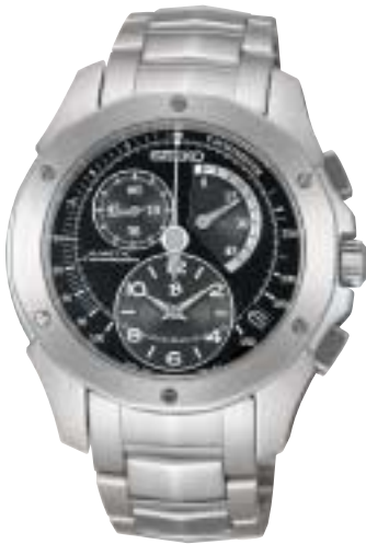
SAGE001 126,000円 (税抜120,000円)

ハートカムによるクロノグラフ針の瞬間帰零方式を採用。 その操作感には、潔さと愉しさが同居し、大人の遊び心を刺激する。