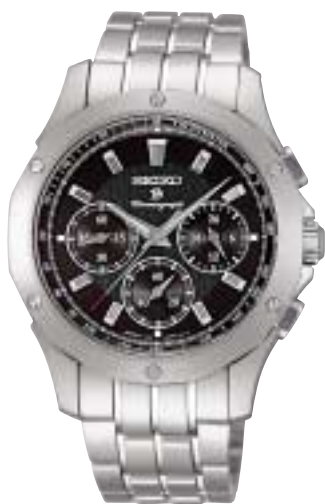
SAGJ011 105,000円 (税抜100,000円)