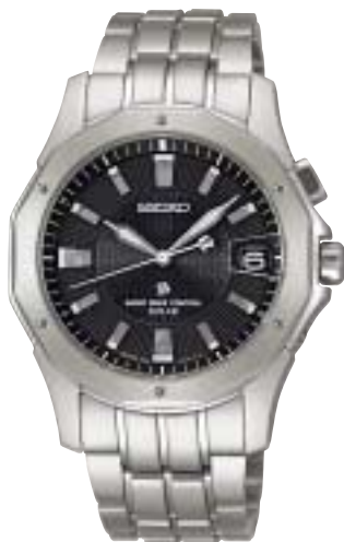
SAGZ001 94,500円 (税抜90,000円)