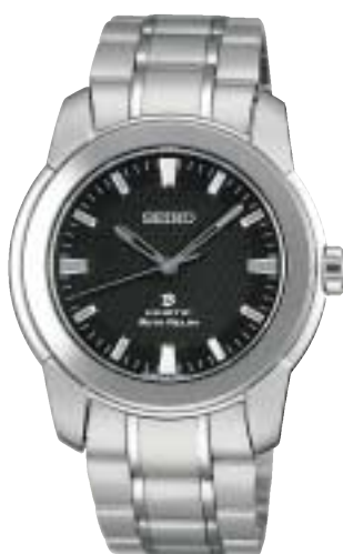
SAGB001 73,500円 (税抜70,000円)