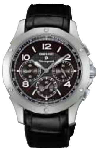
SAGJ015 99,750円 (税抜95,000円)