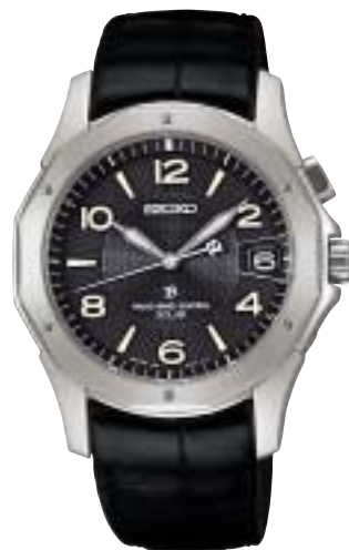
SAGZ005 84,000円 (税抜80,000円)