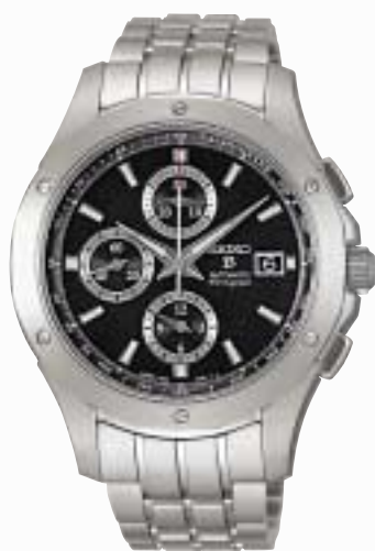
SAGP003 241,500円 (税抜230,000円)